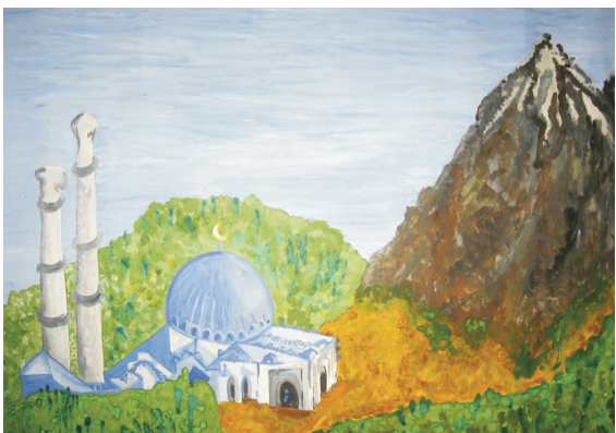
Один из рисунков, представленных на конкурс, посвящённый празднику Наурыз. Автор Раджабова Камилла (СШ с. Подлесное)