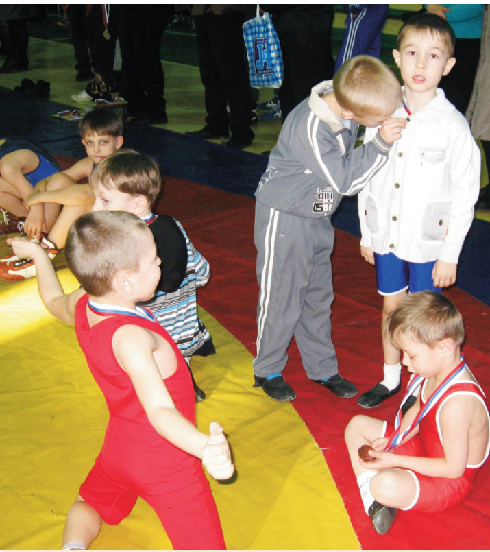
Настоящие победители всегда остаются детьми

По числу участников наибольшая конкуренция сложилась среди самых маленьких: в весовой категории до 29 кг набралось аж 20 претендентов. Трудно было идти к победе и в