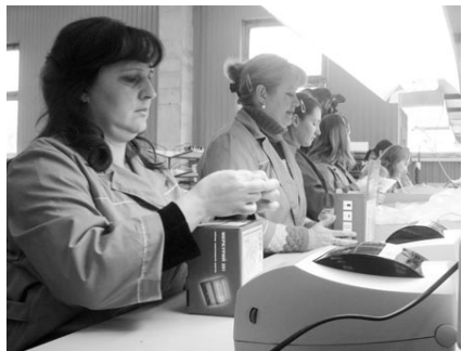
Упаковка счетчиков электроэнергии

Однако, кластер — это не только «Моссар», но и ряд энгельских предприятий. Горшенин в своём докладе назвал ЭПО «Сигнал» и НПФ «Контакт». По его словам, развитие этой связки предприятий позволит втрое увеличить объёмы производства, создать дополнительно 800 рабочих мест и довести ежегодное поступление налогов в бюджет до 786 млн. руб.