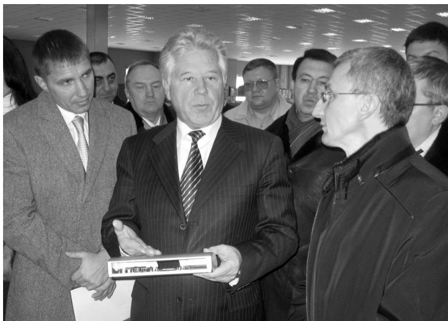
В руках у губернатора электронноцифровая приставка для телефона

Вместе с тем, на предприятии реализуется масштабный инвестиционный проект по производству современных светодиодных светильников. В