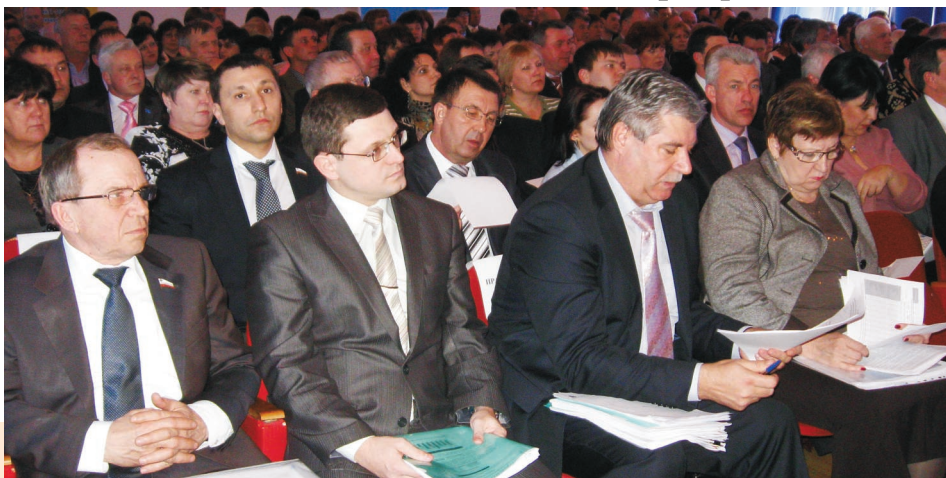
Актовый зал администрации рассчитан на 180 мест, но этого не хватило. Чтобы вместить всех гостей, пришлось доставлять ещё два ряда стульев

В Марксе собрались представители Энгельса и Балаково, а также Пугачёвско- го, Советского, Фёдоровского, Ровенского и Базарнокарабулакского районов.