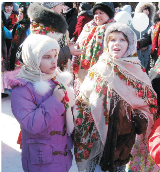
«Ух ты, Масленица!» Своего выступления ждут юные артисты школы искусств