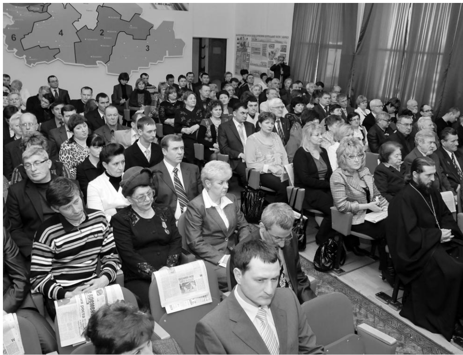
Актив района всегда собирает полный зал, поскольку на этих совещаниях озвучиваются главные индикаторные показатели социальной сферы, промышленности, сельского хозяйства