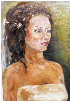
Автор стихов и его портрет