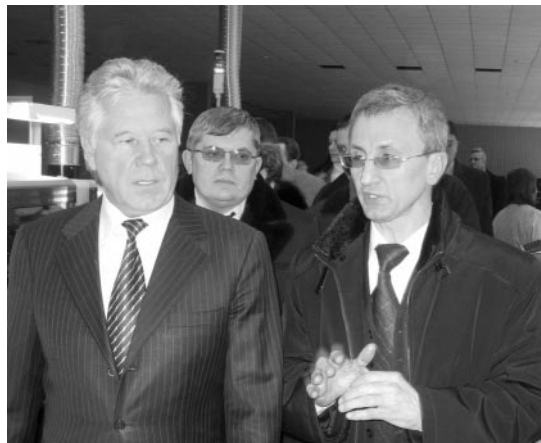
Губернатор Павел Ипатов во время посещения НПФ «Моссар», 2009 год. Слева — руководитель предприятия Евгений Морозов

Для сравнения: ЗАО «Вагонстроительный завод», производящий запчасти и детали для вагонов, металлургии и химической отрасли, планирует перечислить 10 млн. руб., ОФО «НИТИ-Тесар» — 9 млн. руб., ФГУП «Саратовский агрегатный завод» — 47,7 млн. руб., ФГУП «НПП «Алмаз» — 57,7 млн. руб., а ОАО «Совхоз-Весна», крупнейший круглогодичный производитель овощей — 30,2 млн. руб.