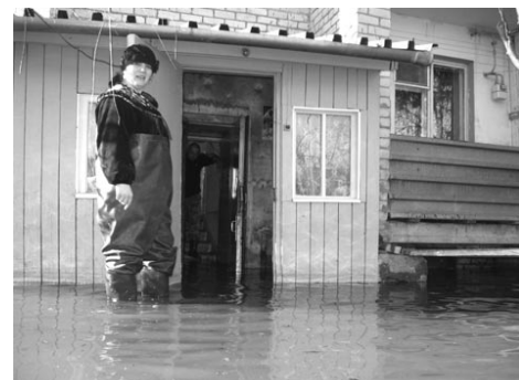
Главное, чтобы не повторилась ситуация прошлой весны, когда топило дома за автовокзалом. Фото сделано в апреле 2010 года, дом 31 на Комсомольской улице