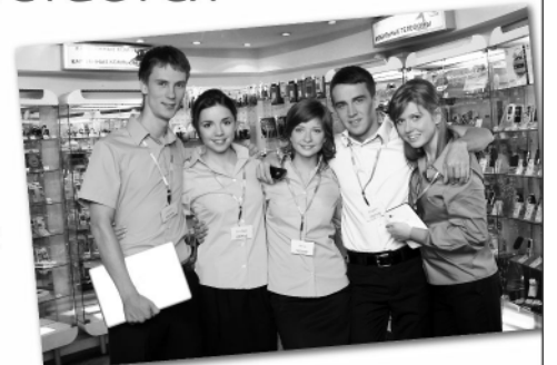
График работы: 2/2, 5/2.

Оплачиваемая стажировка, оформление по Трудовому кодексу. Возможность быстрого карьерного роста.