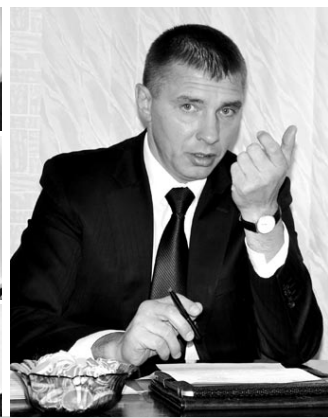
Вопросов было много, обсуждение было бурным, но конструктивным