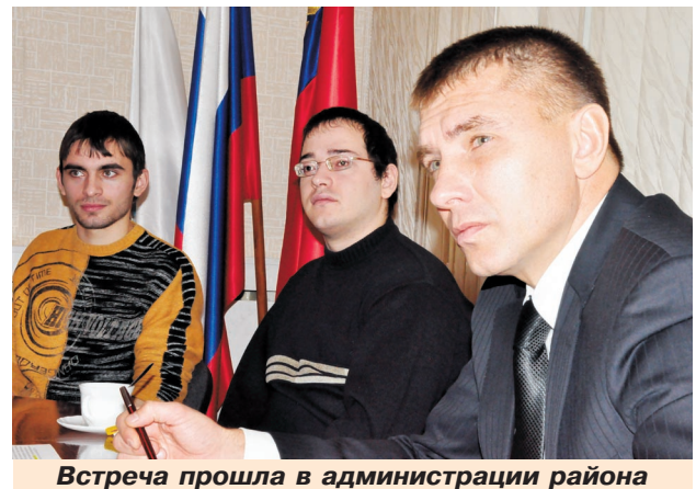
Встреча прошла в администрации района