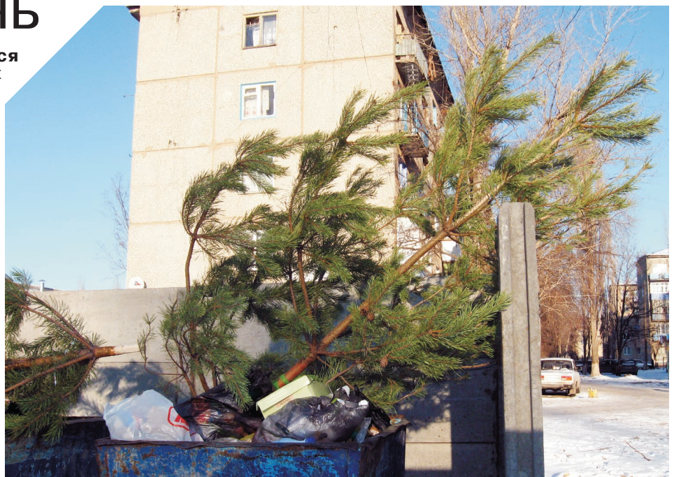
Люди украсят Вами свой праздник лишь на несколько дней...

На Западе рентабельность переработки хвойных деревьев доходит до 30%. В Канаде, например, из хвойных деревьев делают лекарство против гриппа. Кроме того, ёлки перерабатывают в компост, используемый в городских парках. В Испании из ёлок изготавливают технологическую щепу на подстилку скоту. А вот французы перерабатывают ели в мульчу, широко используемую на городских газонах. Энергетическим сырьём стали новогодние ёлки и в Берлине: смесь из опилок, хвои и угля горит быстро, даёт много энергии и уменьшает выброс углекислого газа. В морозную зиму ёлочное тепло экономит сотни тысяч евро. Несмотря на столь рачительное использование ёлок и сосен, их всё же жаль. В России, пожалуй, радует лишь тот факт, что, по подсчётам специалистов, с каждым годом уменьшается число россиян, предпочитающих живые символы Нового года. В отли-