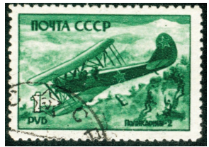
Почтовая марка СССР военных лет

1928 г. М.М.Громов совершил первый полёт на самолёте У-2, серийное производство которого продолжалось до 1953 года. Всего построено около 33 тыс. единиц.