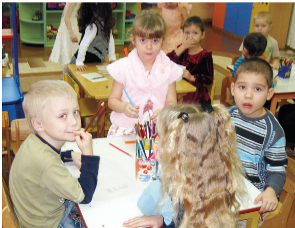
Детей заботы взрослых не интересуют. Они просто знают, что в их детском саду красиво и уютно, а ещё — заботливые и добрые воспитатели

Коллектив детского сада выражает огромную благодарность за помощь в открытии дополнительной группы руководству племзавода «Трудовой», комитету образования и родителям, которые тоже внесли большой вклад в общее дело.