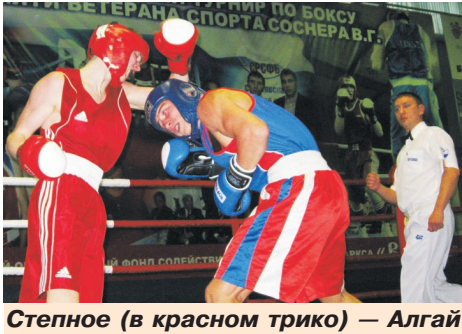
Степное (в красном трико) — Алгай

В финал в разных возрастах и весовых категориях вышло 27 пар. Среди них спортсмены, представляющие Волгоград, Оренбург, казахстанский Уральск, пензенский Сердобск, Саратов, а также Степное, Вольск, Алгай, Балаково, Базарный Карабулак, Энгельс, Балашов и Хвалынский.