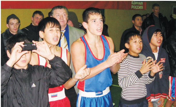
Во время каждого боя зал взрывался гулом эмоций. Бокс в Марксе всегда собирает полные трибуны. Сами спортсмены, покидая ринг после боя, часто остаются рядом, чтобы поддержать товарищей