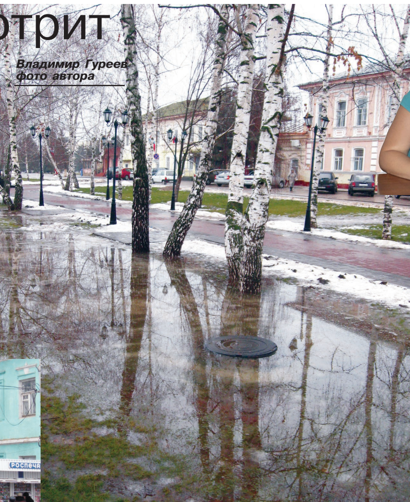
Владимир Гуреев фото автора

В первый день наступающего года температура опустится ещё на пару градусов и продержится в этих пределах до 5 января, по ночам опускаясь до -11. Но капризные перемены ветров и температур заставляют и тут ждать подвоха: вдруг зима перепутает и заглянет в весенний календарь?