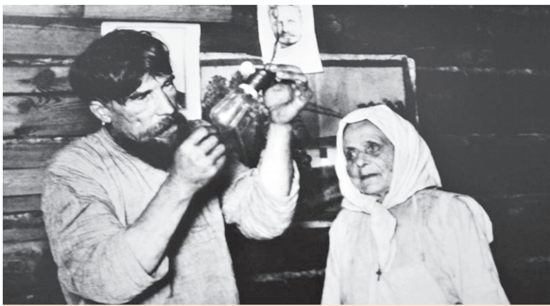
Знаменитый снимок лампочки Ильича. Снимок середины 20-х гг. прошлого века.