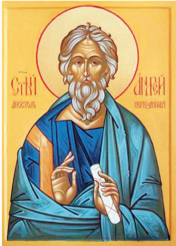
Икона святого апостола Андрея Первозванного

Стойко принял Андрей решение правителя, и с молитвой сам взойшёл на место казни. Чтобы продлить его мучения, Эгеат приказал не прибивать руки и ноги святого, а привязать их к кресту. Два дня апостол креста учил собравшихся вокруг горожан. Люди, слушавшие его, всей душой сострадали ему и потребовали снять святого апостола. Испугавшись народного возмущения, Эгеат приказал прекратить казнь. Но святой апостол стал молиться, чтобы Господь удостоил его крестной смерти. Как ни пытались воины снять апостола Андрея, руки им не повиновались. Распятый святой, воздав Богу хвалу, произнёс: "Господи, Иисусе Христе, прими дух мой".