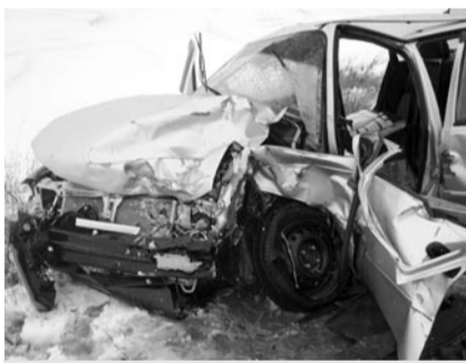
Всё что осталось от «Нексии» после аварии. Но это ничто по сравнению с человеческой жизнью