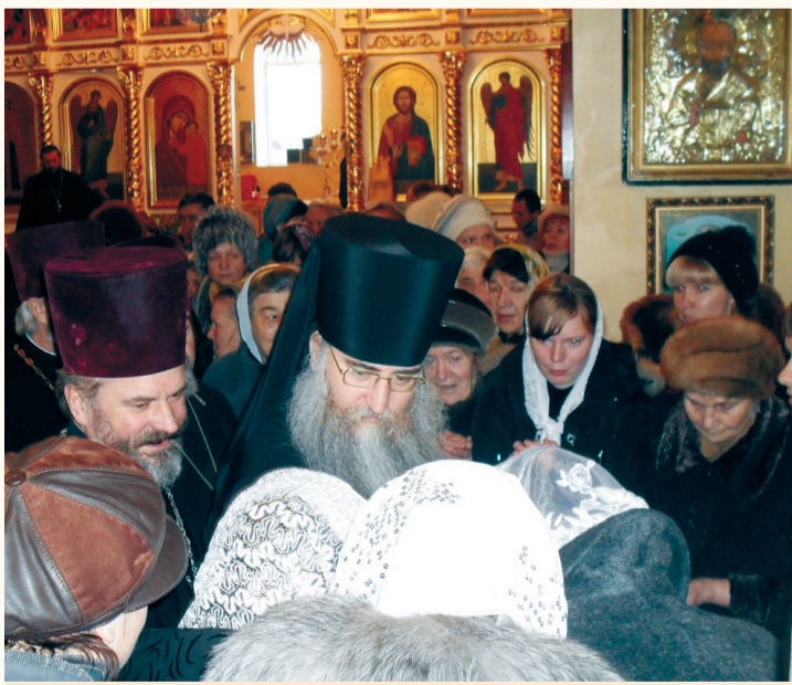
Благословение от Владыки

Рубрика выходит по благословию Епископа Саратовского и Вольского Лонгина.