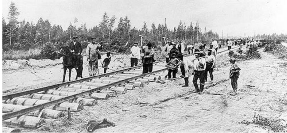
Строительство железной дороги.