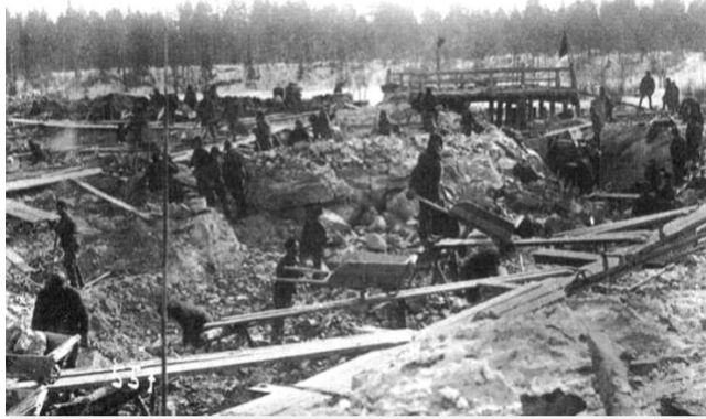
Строительство Беломорско-Балтийского канала, 1931-1933 гг.

В сентябре 1946 года нашу 127-ю колонну повезли в Украину, в Днепродзержинск, восстанавливать кондитерскую фабрику. Там же на других объектах работало много военнопленных, с которыми вообще не общались. В конце 1947 года я вернулся, наконец, домой, с уголь-