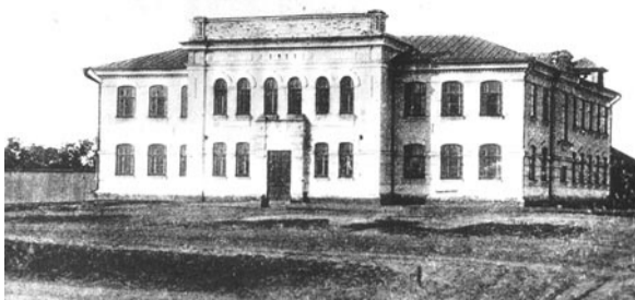
Мужская гимназия в Екатеринбургше. Фото до 1917 г.