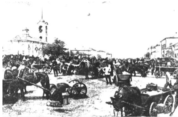
Базарный день в Екатеринбургше. Фото до 1917 г.

Окончить институт, однако не пришлось — началась война, последовала депортация в Сибирь вместе с семьёй. Все считали, что это временно, такова необходимость военного времени. По прибытии в Сибирь я добровольно мобилизовался на работу на станцию Таштагол Кемеровской области.