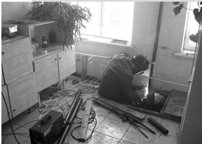
Светлым пятном на фоне общих проблем села стало завершение работ по ремонту системы отопления в лечебном учреждении Липовки