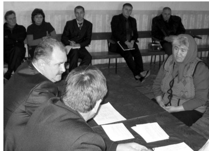
Приём граждан — это возможность задать свой вопрос и получить на него ответ из первых уст

— Кому-то одному нести на своих плечах эти проблемы тяжело. С ними не справится государство, муниципалитет, район и хозяйство, если все будут врозь. А если вместе, то можно.